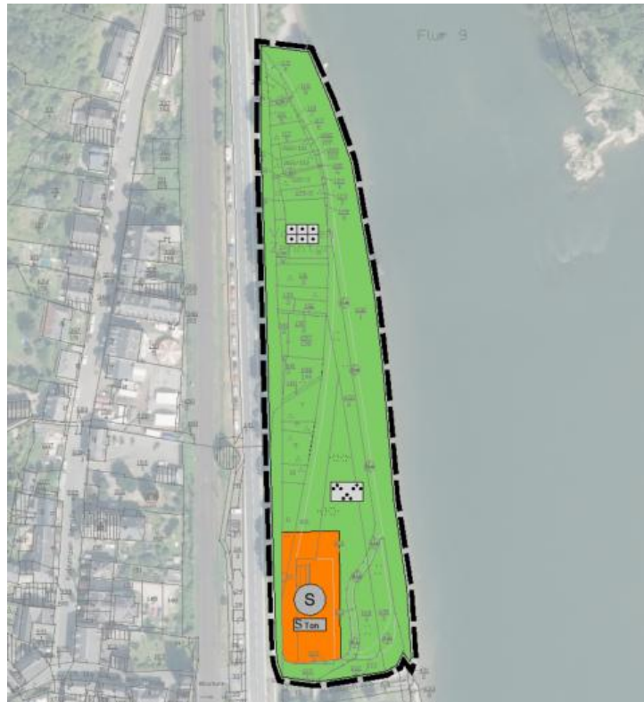
Abbildung 3: Darstellung der anstehenden FNP Änderung "Tonnenhof" (Abbildung unmaßstäblich, Dörhöfer & Partner 2025)

Der Änderungsbereich „Tonnenhof“ umfasst eine Gesamtfläche von rund 1,4 Hektar. Die Erschließung erfolgt über die bestehende Rheinpromenade sowie das Wegenetz der Rheinanlagen. Der Geltungsbereich liegt vollständig im festgesetzten Überschwemmungsgebiet. Nachfolgend die Darstellung der aktuellen FNP Änderung (Bereich „Tonnenhof“):